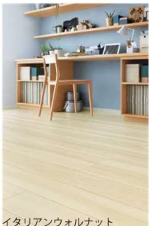
イタリアンウォルナット