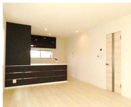
イタリアンウォルナット × イタリアンウォルナット