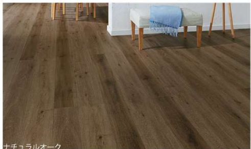
ナチュラルオーク