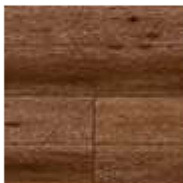
ナチュラルオーク