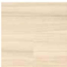
イタリアンウォルナット