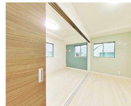
イタリアンウォルナット × チェリー